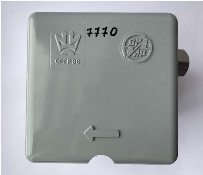
Приложение №2. Фото оригинального реле ООО «ИЦ ОРГРЭС»